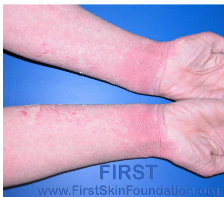
Symptomer på Nethertons syndrom. (Bildet gjengitt med tillatelse.)